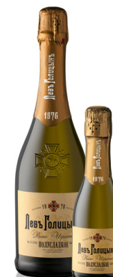
ВИНО ИГРИСТОЕ ПОЛУСЛАДКОЕ БЕЛОЕ «НАСЛЕДИЕ МАСТЕРА «ЛЕВЪ ГОЛИЦЫНЪ»

Яркий сбалансированный аромат, напоминающий о свежих ягодах и цветущих садах. Вкус мягкий и гармоничный с легким приятным послевкусием.