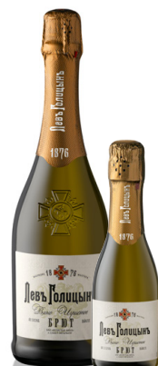
ВИНО ИГРИСТОЕ БРЮТ БЕЛОЕ «НАСЛЕДИЕ МАСТЕРА «ЛЕВЪ ГОЛИЦЫНЪ»

Насыщенный аромат с изысканными ягодно-цветочными нотками. Вкус мягкий, гармоничный с освежающей кислотностью и приятным длительным послевкусием.