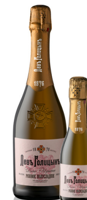
ВИНО ИГРИСТОЕ ПОЛУСЛАДКОЕ РОЗОВОЕ «НАСЛЕДИЕ МАСТЕРА «ЛЕВЪ ГОЛИЦЫНЪ»

Яркий, свежий, освежающий, сбалансированный вкус, с изысканными фруктовыми нотами и ягодными нюансами, с долгим приятным послевкусием ягод.